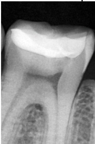
Figura 02 – Radiografia do elemento 46 no pós-operatório imediato.

No intervalo de 15 dias após o tratamento, o paciente retornou a Clínica Escola, para uma nova avaliação radiográfica (Figura 03).