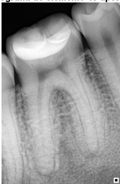
Figura 04 – Radiografia do elemento 46 após 30 dias de procedimento

Disponibilizou-se ao paciente a Escala Analógica Visual (EVA) para analisar a sensibilidade do voluntário em 24 horas, 48 horas, 7 dias, 15 dias, 30 dias após intervenção. Na qual, obteve-se o resultado 0 no grau da sensibilidade para todos os intervalos que foram avaliados (Figura 05).